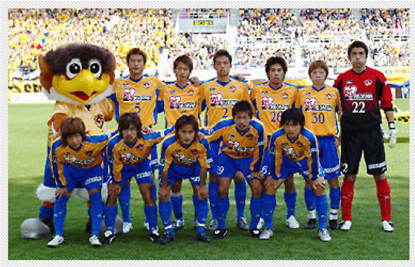
ベガルタ仙台の不敗神話