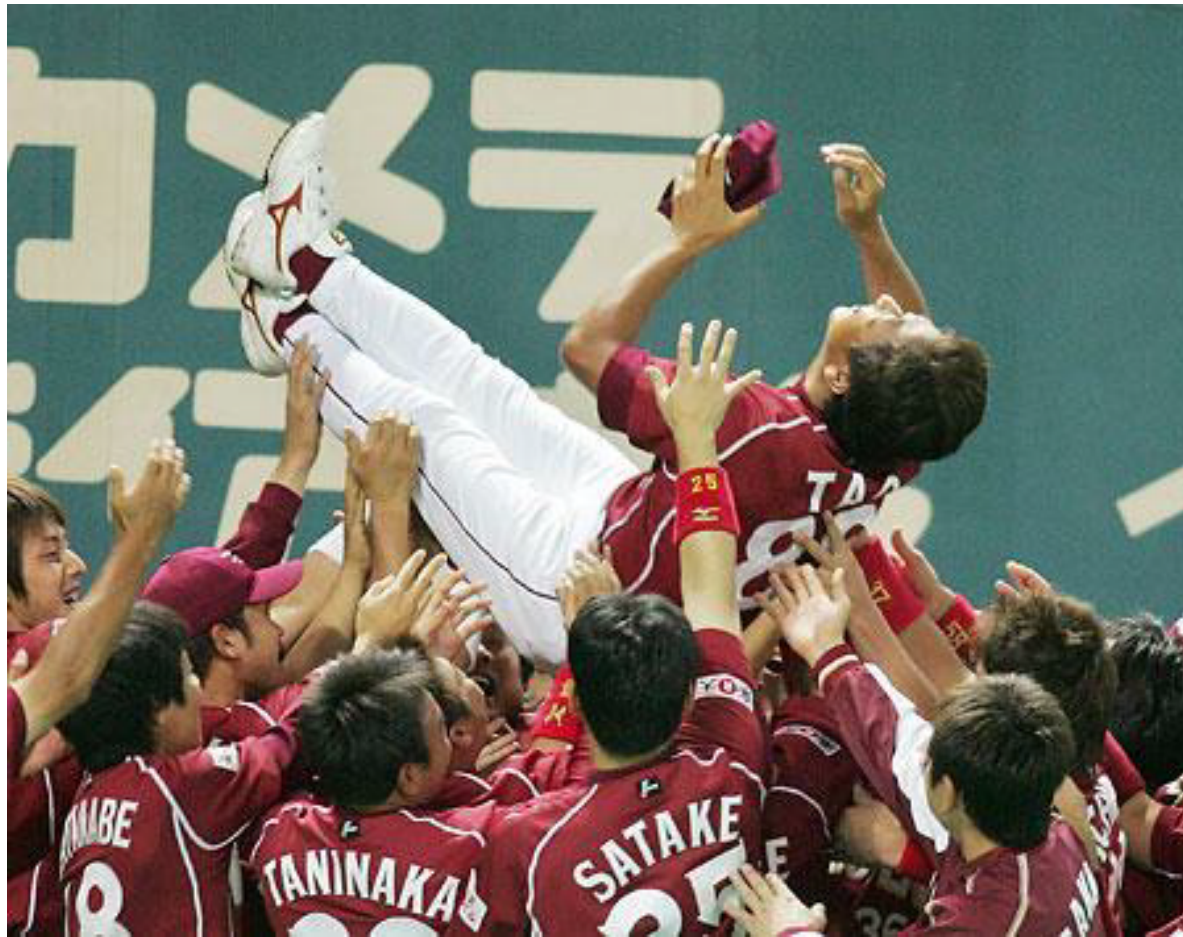
楽天イーグルスのホームゲーム