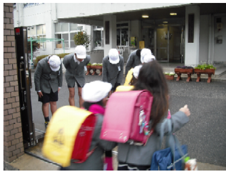
<6年生による朝のあいさつ運動>

先日、バスケットボールの6年生大会がありました。6年生にとつては最後の試合でした。いつもそばにいてくれたやさしい6年生がいなくなったら、とてもさみしくなってしまう。チームに入ったばかりの時、とても不安だった私に、一番に声をかけてくれたのが6年生でした。6年生にはげましてもらうと、とてもうれしくなつて、がんばろうという気持ちになりました。試合の時、きんちようとして動けなかった私に「みゆー、ボールもらいにいつてこらん」と声をかけてくれ、やつてみようという気持ちになりました。6年生がいなくなつても、明るくて元気なチームでいられるようにがんばります。私も6年生みたいに、あとから入ってきた子に、声をかけてあげようと思います。今までやさしくしてくれた6年生、ありがとうございます。これからも一歩一歩がんばります。